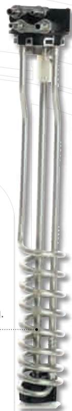
Modell TV3 Integrerad sug och retur av AdBlue. Kylvattenkrets för uppvärmning. Temperaturgivare. 80,5 mm bajonettfatning.