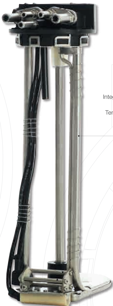
Modell TZLQ Integrerad sug och retur av AdBlue. Kylvattenkrets för uppvärmning. Temperaturgivare. Inklusive sensor för mätning av AdBluekvalitet. 102,4 mm bajonettfatning.