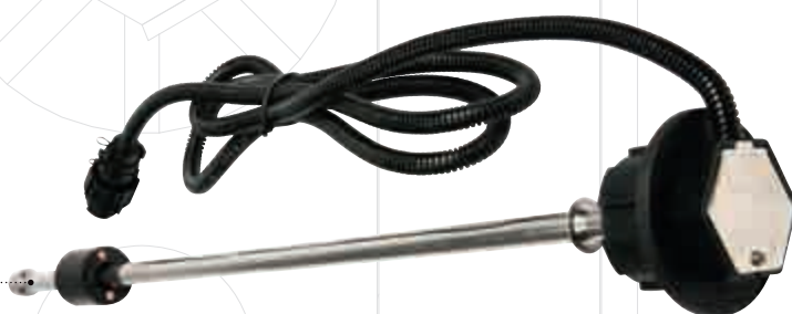
Modell TU För nivå- och temperaturmätning av AdBlue. Kan anpassas till olika tankformer. 54 mm bajonettanslutning.